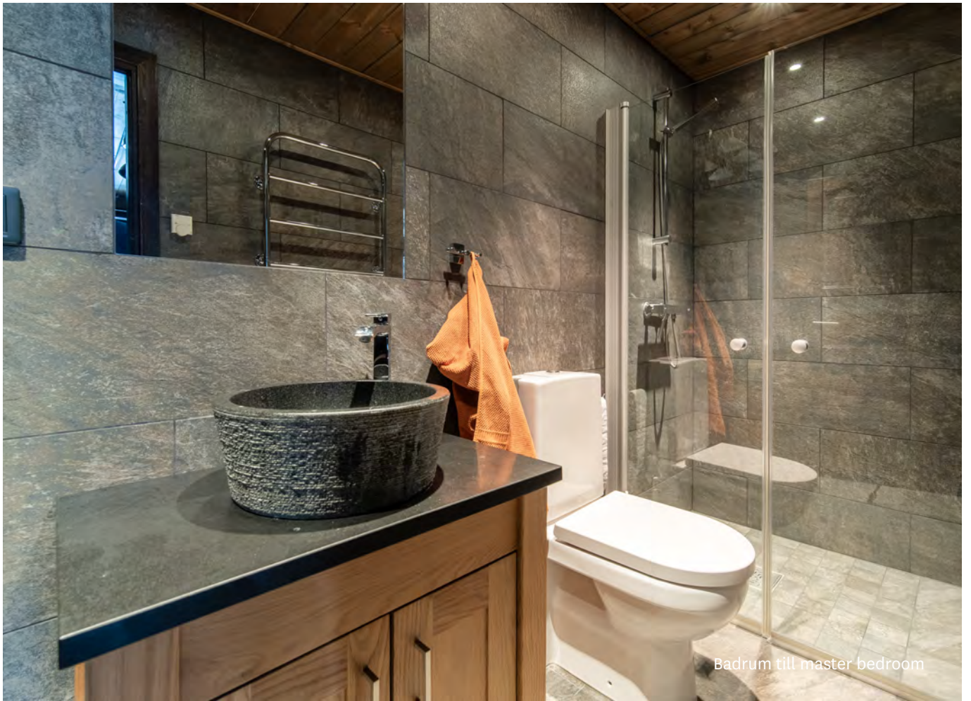
Badrum till master bedroom